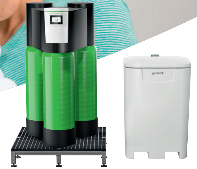
Enthärtungsanlage softliQ:LB auf Podest