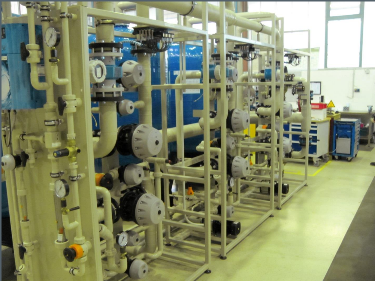
Anlage bei der Werksabnahme